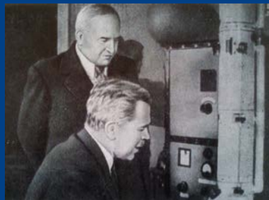
Академики С.И.Вавилов и А.А.Лебедев, ГОИ, 1940 год